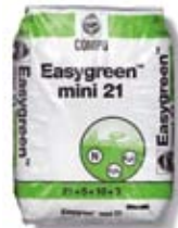
Easygreen® Mini 21