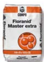
Floranid® Master Extra