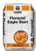
Floranid® Eagle Start