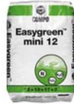
Easygreen® Mini 12