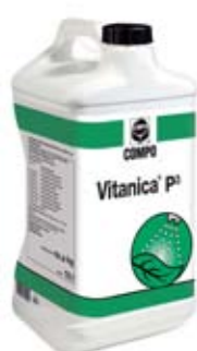
Vitanica® P 3

Aplicação: Ideal para greens, tees e relvados de alta qualidade, no momento de adubar, antes de um torneio ou contra o ataque de fungos. Dose: 15-30 g/m 2 .