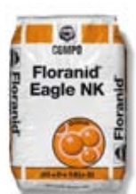
Floranid® Eagle NK