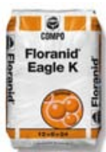
Floranid® Eagle K